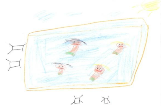
Serdar Ali YARDIMCI 7,6 YAŞ

güvendiği bir yetişkine söylemekte tereddüt yaşamaması gerektiğini vurgulayın.